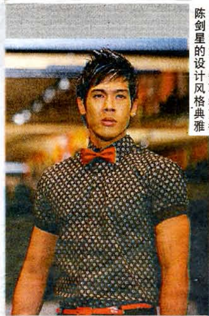
兼具复古风情。中带活泼，每项裁剪都陈剑星的设计风格典雅